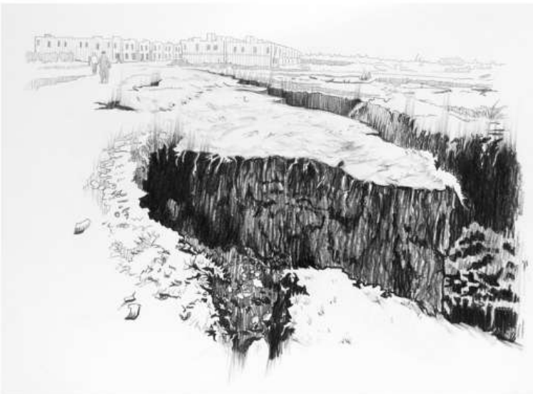
Del proyecto Las cosas no caen del cielo, "Se abrió la tierra (socavón)", lápiz sobre papel, 29.7 X 42 cm., 2019