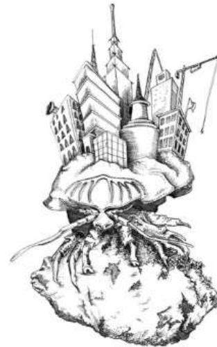
"La peste", tinta sobre papel, 29.4 X 22 cm., 2011